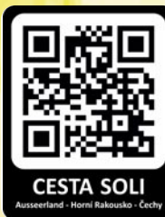
Naskenujte si QR kód a objevte na internetu CESTU SOLI 6 Bad Ischl - náměstí v Pernecku 7 Bad Ischl - Sudhaus (solivar) 8 Historické nádraží Engelhof v Gmundenu 9 Strážní domek č. 39 v údolí Gusental 10 Most Kronbachbrücke u Waldburgu 11 „Historické cestování“ koněpřežka v Rainbachu 12 Koněpřežka a muzeum v Bujanově 13 Náměstí Přemysla Otakara II. v Českých Budějovicích

Vydejte se na CESTU SOLI z oblasti Ausseerland přes krásnou krajinu Horního Rakouska, navštivte četná kulturní a výrobní místa spojená s bílým zlatem. Zažijte hornorakouskou a českou kuchyni a seznamte se s jižními Čechy na trase koněpřežky až do Českých Budějovic, konečného bodu této dálkové pěší trasy.