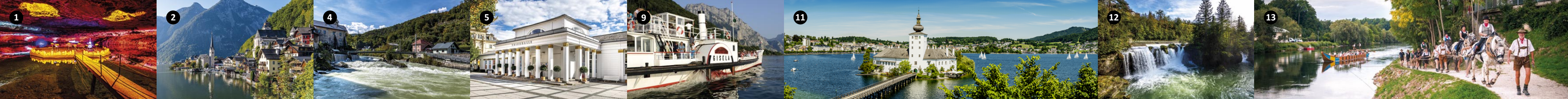
1 Salzwelten Altaussee - solné jezero v solném dole 2 Hallstatt v ranním světle 3 „Der wilde Lauffen“ u poutního místa Lauffen 4 Kolonáda v Bad Ischlu 5 Kolesový parník GISELA na jezeře Traunsee 6 Bývalé sídlo solního úřadu v Gmundenu se zámek Ort na jezeře Traunsee 7 Přírodní zážitek z vodopádu Traunfall poblíž Roithamu 8 Tažení lodí proti proudu řeky Traun jako nemateriální kulturní dědictví UNESCO