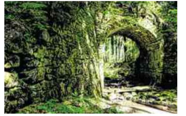
Versteckte Spuren in den Mühlviertler Wäldern