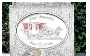
In St. Magdalena sind es 80,4 Kilometer in beide Richtungen