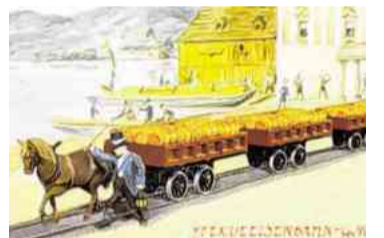
Endstation in Gmunden – hier wurde die „Eisenbahn“ mit Salz beladen.

Gmunden ist angedacht. Wie finden Sie das?