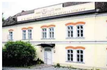
Der Südbahnhof in Linz war der große Bahnhof.