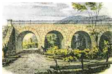
Über dieses Viadukt ging es in Urfahr über den Haselgraben.